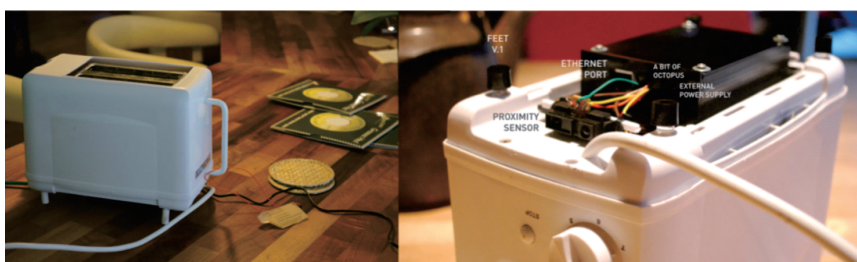
图3 布拉德（Brad）烤面包机 1 ，2007年。

3)。同样，詹姆斯·钱伯斯（James Chambers）设计的“健康收音机（Gesundheit Radio）”通过间歇性地释放灰尘以保持其最佳功能。该收音机的名称源自德语“身体健康”一词，其设计的独特之处在于优先关注自身的“生存”需求（图4）。朴秀美（Soomi Park）设计的“尴尬机器人（Embarrassed Robots）”则进一步体现了这一趋势（图5）：作为服务型机器人，除了做好“本职工作”之外，还具备“尴尬”这一人类的典型情感属性，能模仿人类脸红时的样子，以消除人类的不适感和陌生感。这一类反事实人工物，尽管看上去不可思议、不符常理，但经过物联网、大数据等技术赋能之后，具备了“类人又异人”的能动性，体现出了另类个性。