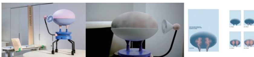
图5 尴尬机器人（Embarrassed Robots） 3 ，2017年。