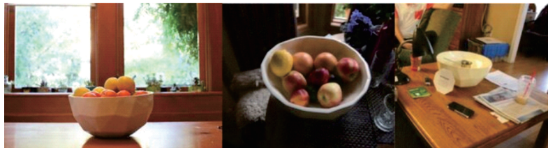
图1 倾斜碗 (Tilting Bowl), 2022年。

反事实人工物旨在故意创建出与当前给定的设计规范与设计产品的逻辑或合理内容相矛盾的东西。“反事实人工物”是思辨设计中常见的原型类型，是一种典型的以他者性为中心的设计产物。这种对规范的对抗，既保证反事实人工物具有某种“功能性”以便人们使用，也开辟出对多种替代性(alternativeness)存在(或假设)进行经验性研究的可能性，具体体现为一种与反事实人工物共同生活的另类现实。反事实的设计策略既容易分析事物之间的多重关系，也有利于产出基于事物的生活或现象学经验的多重阐释。通过整合反事实思维与反事实人工物，使人们转移关注对象，不再执着于某一个视角，以重建事实的多维面向。