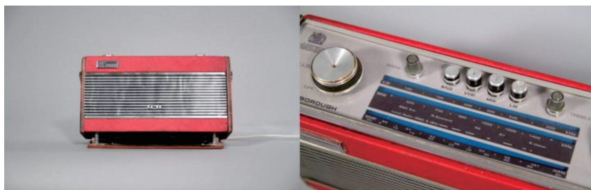
图4 健康收音机（Gesundheit Radio） 2 ，2010年。